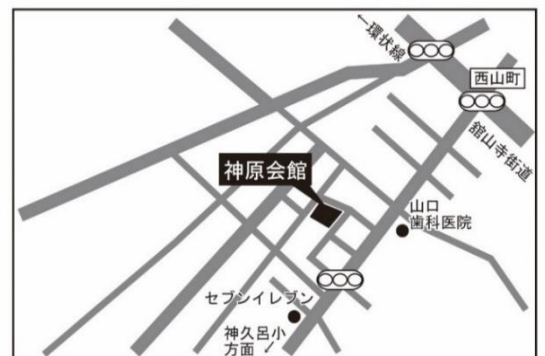
●おでかけルーム 浜松市中央区神原町772-6 (会館の駐車場が使えます)