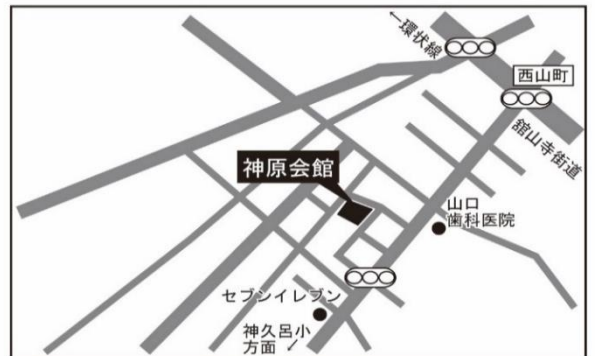
●おでかけルーム 浜松市中央区神原町772-6(会館の駐車場が使えます)