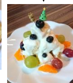
🌿 Xmas cake!